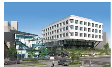
※新校舎完成イメージ

個別ブースデスクのある歯学部6年生向けの自習室やグループで利用できるセミナー兼自習室など、学修に集中できる新校舎が2023年に完成予定。