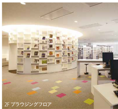
2F ブラウジングフロア

グループワークができるスタジオでも、書籍やICT(情報通信技術)が利用可能です。