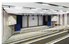
1F・2F 明倫(大ホール) Map 2

厳肅な雰囲気にもまれた、約370人収容の大ホール。各分野で活躍する専門家や企業家を招いた講演会、最新の研究成果を発表する学会などを開催し、地域、世界、未来に向けて最先端の知を発信します。