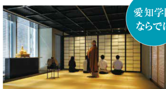
愛知学院ならではの