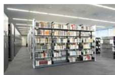
1F アカデミックフロア