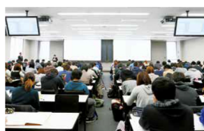
1F・2F・3F 大教室 Map 1

厳肅な雰囲気にもまれた、約370人収容の大ホール。各分野で活躍する専門家や企業家を招いた講演会、最新の研究成果を発表する学会などを開催し、地域、世界、未来に向けて最先端の知を発信します。