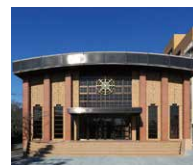
110周年記念講堂 Map 7 愛知学院創立110周年の節目に建設。卒業式や講演会などを開催。