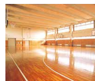
体育館 Map 9 多目的に利用できる体育館をはじめ、各種スポーツ施設を整備。