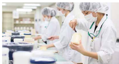
薬学部調剤実習室

実際の医療現場と同様の最新機器がそろった実習室があり、調剤に関する知識を養うことができます。また、棟内には薬学部研究室やカフェテリアも。