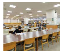
歯学・薬学 図書館情報センター Map 8