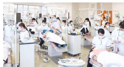
歯科衛生学科臨床実習室

20台の診療台ユニットを設置した臨床実習室、口腔模型を使った実践的な学修ができる模型実習室があります。憩いの場になるラウンジも設置。