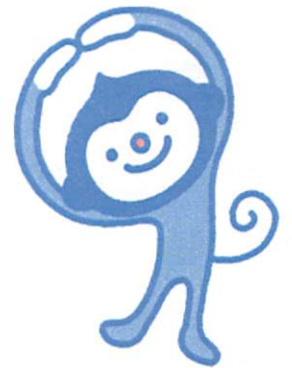
日本糖尿病協会マスコット マルくん